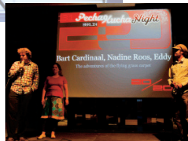
Präsentationen im 20-Sekunden-Takt. Die Stechuhr setzt das Zeitlimit für die Vorträge.

Web-Link www.pechakucha.de www.pecha-kucha.org